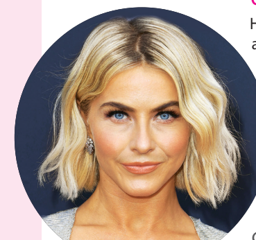
Julianne Hough (30)

Die In-Frisur der Stunde: Ob kurzes oder langes Haar – softe Locken stehen allen Frauen