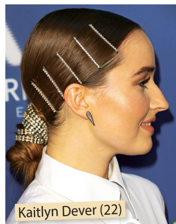
Kaitlyn Dever (22)